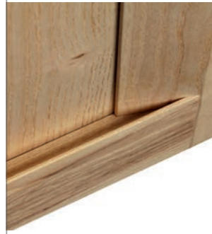
Particolare presa maniglia Detail pre-handle

Anta a telaio in Frassino spazzolato e laccato